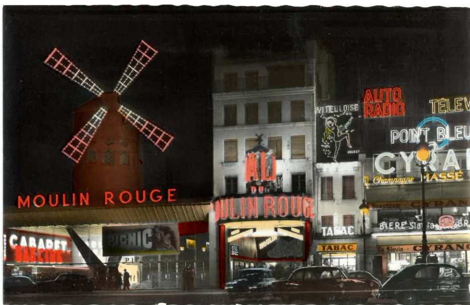
"Paris la nuit, Le Moulin Rouge". Principios del siglo XX. Fotografía extraída de la serie "Paris la nuit – 10 photos véritables en couleur, Édition E.R., Paris, Véritable photo au bromure".