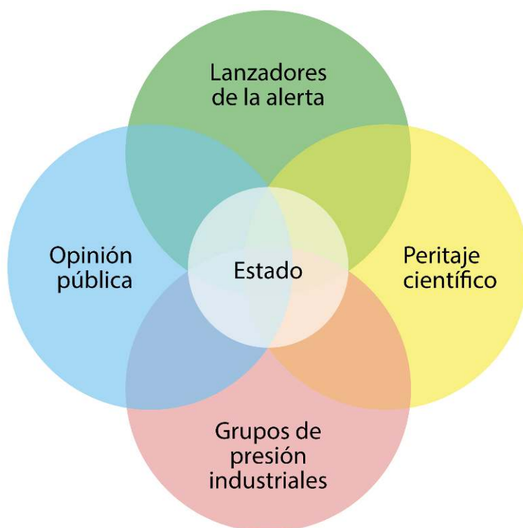
Figura 1. El juego de los actores en interacción con motivo de la fabricación de los problemas medioambientales y los conflictos que les son asociados.