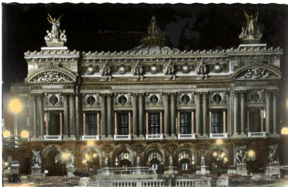
"Paris la nuit, l'Opéra". Principios del siglo xx. Fotografía extraída de la serie "Paris la nuit – 10 photos véritables en couleur, Édition E.R., Paris, Véritable photo au bromure". Archivo del Colectivo RENOIR.